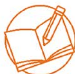
基本的教育と出字率向上