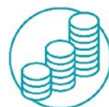
地域社会の経済発展