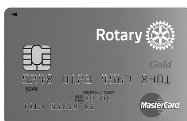
個人: ゴールドカード