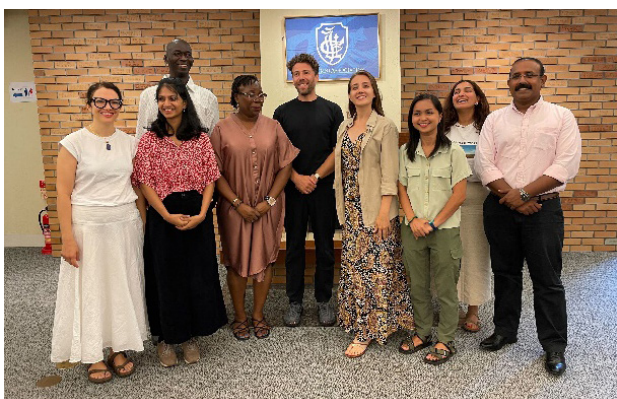
第22期平和フェロー9名 ICUにて 2024.8.21