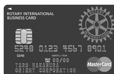
会社等: ビジネスカード