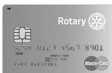
個人: スタンダードカード