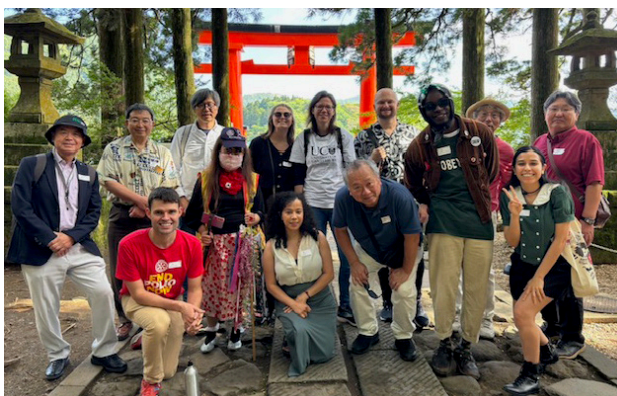
日本文化交流会 2024. 5.11 （箱根, 湯河原にて）