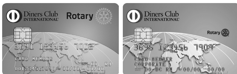
クラブ/地区/委員会用