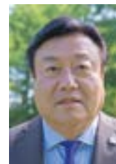
2024-25年度ガバナー 寒郡 茂樹

『Magic of Rotary』を感じる事ができる、ロータリアンによるロータリアンのための祭典、それが地区大会です。ロータリアンとしてのかけがえのない経験を共有することにより、理念をともにする仲間と、想いを育むことができるはずです。みなさん、一緒に楽しみましょう！