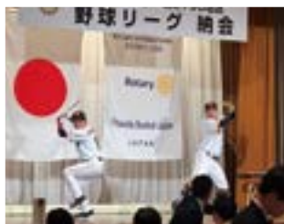
モノマネ芸人 アレ慎之介&さかとも