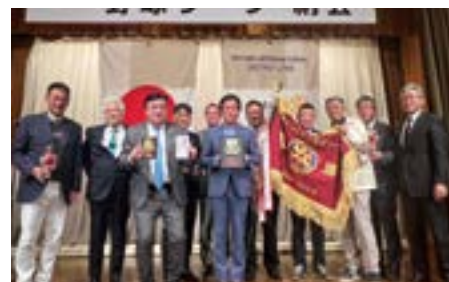
優勝 成田コスモポリタンRC