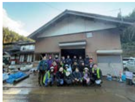
(能登災害復興ボランティア参加時のもの)