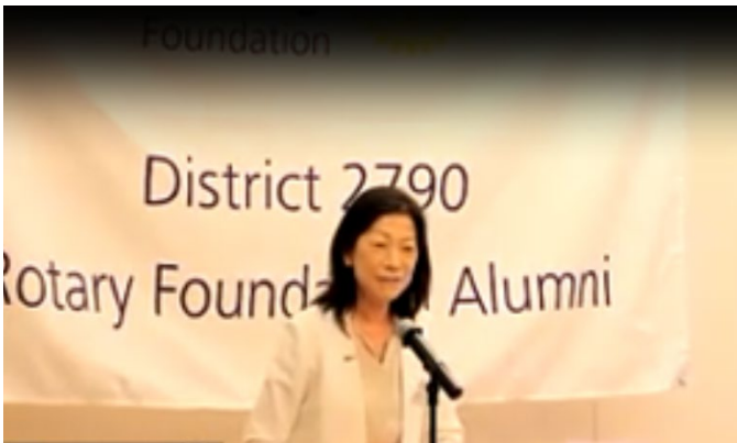
漆原財団統括委員長の卓話