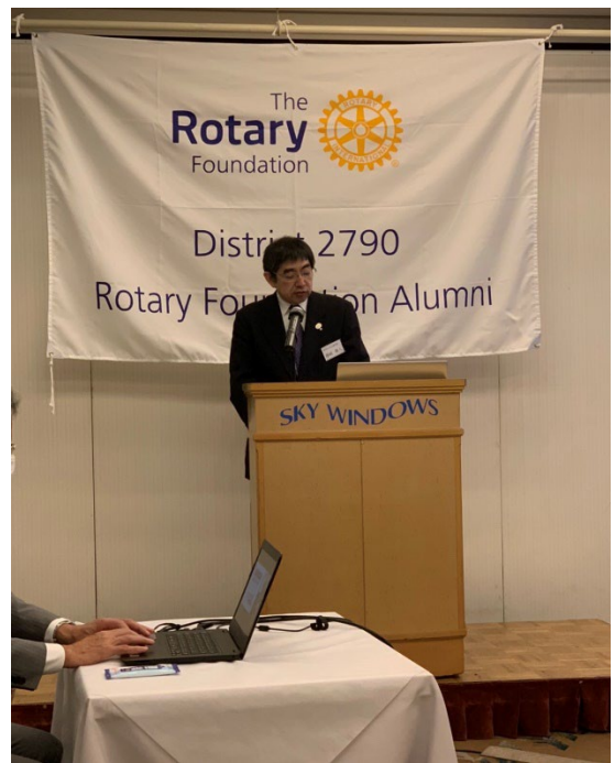
藤崎奨学生・学友委員長ガイダンス