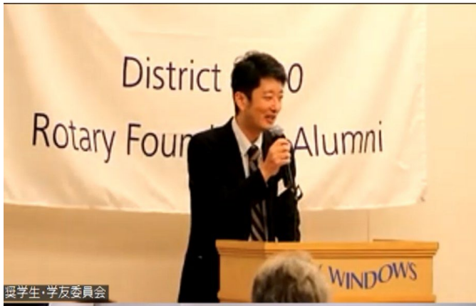
折田奨学生・学友委員(閉会挨拶)