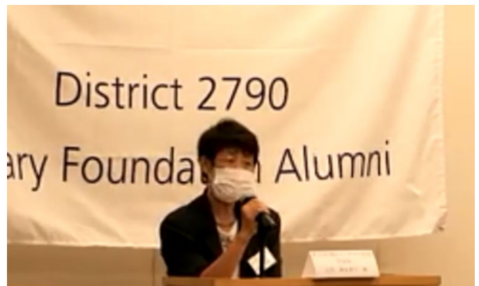
清水学友会会長の卓話