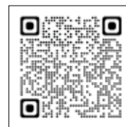
財団 News 記事