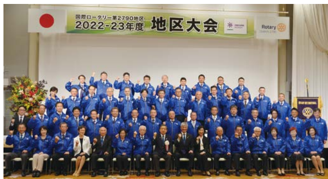
国際ロータリー第2790地区 2022-23年度地区大会