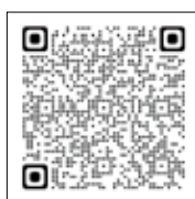
財団セミナー報告