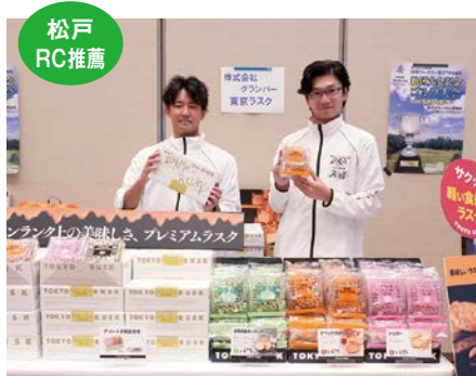
(株)グランバー様 商品分野 ラスク