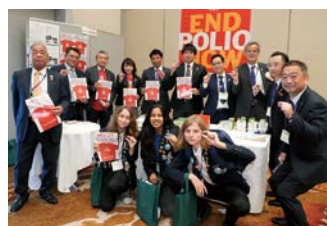
R財団統括委員会展示ブース ポリオプラス寄付