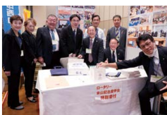
米山記念館奨学委員会 展示ブース