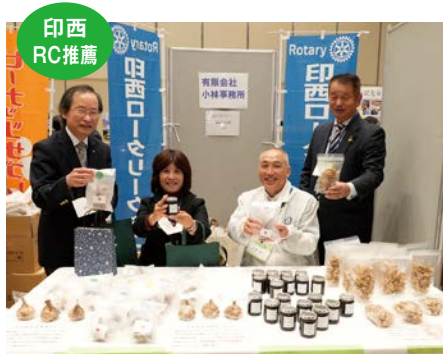
(有)小林事務所様 商品分野 黒にんにく・乾燥野菜・ ホイセンベリージャム