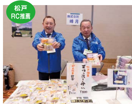
(株)峰月様 商品分野 和菓子