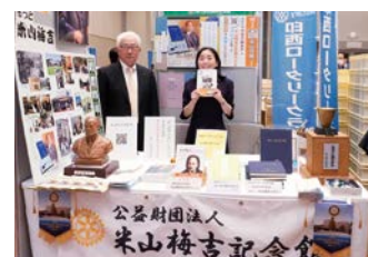
米山記念館展示ブース