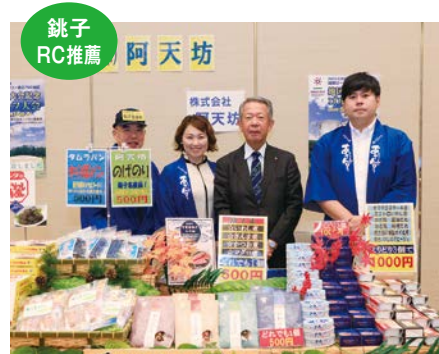
(株)阿天坊様 商品分野 乾物