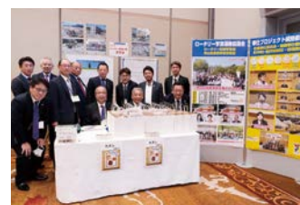
奉仕プロジェクト統括委員会 希望の風寄付展示ブース

米山記念館学友会／研修系3委員会展示1／国際大会展示1／ 奉仕P統括委員会展示2／青少年P統括委員会2／ 管理運営統括委員会展示1／R財団統括委員会展示2