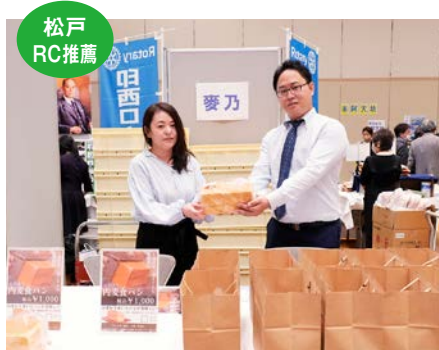
麥乃様 商品分野 パン