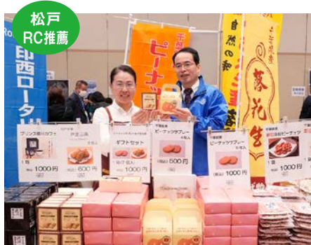
(株)富井様 商品分野 菓子・落花生