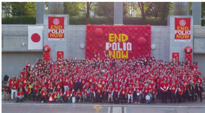
世界ポリオデープロジェクト