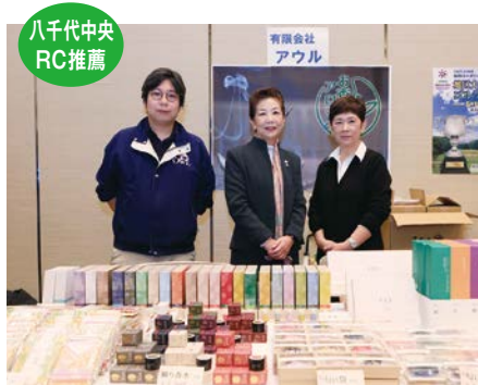
(有)アウル様 商品分野 お香・アロマ等販売