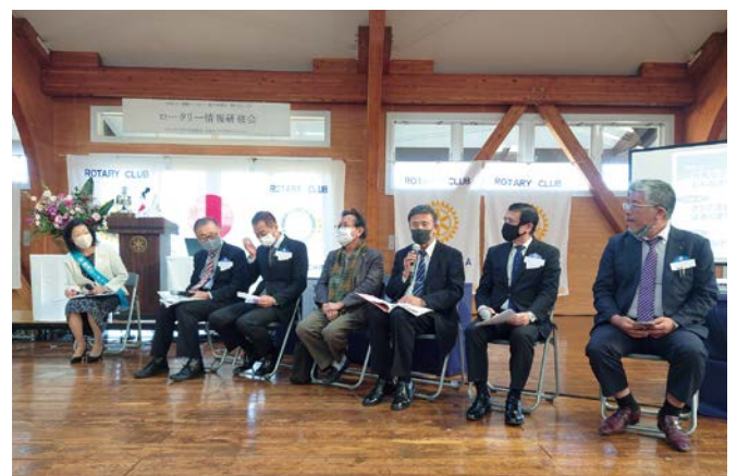
ディスカッション