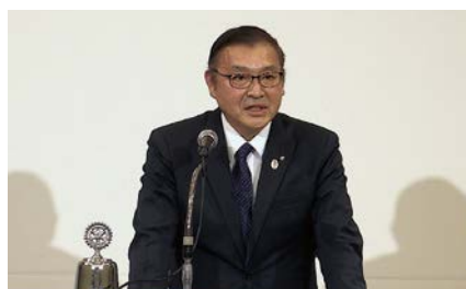
第3グループ星ガバナー補佐